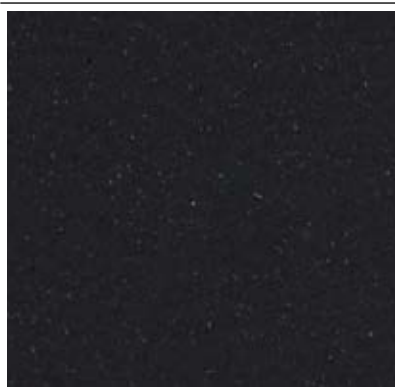
Metalitzats NOR100 (Noir 2100 SableYW359F) 2